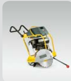
Řezačka spár BFS 1345 B