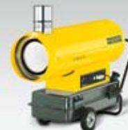
Naftové topidlo HI 47