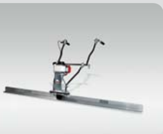
Vibrační lišta P3SA

K dispozici nabízíme také rotační hladičky poháněné benzínovým motorem. Paleta našich strojů k pronájmu je nekompletnější. Kromě toho Vám nabízíme i bohatý výběr elektronických měničů.