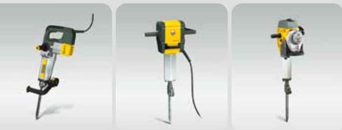
Elektrická kladiva EH 9BL, EH 11 BL