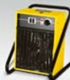
Elektrické topidlo HE 15

Elektrická, naftová nebo plynová topidla: pro každý požadavek máme ten správný přístroj. Stejně jako odvlhčovače vzduchu, které za krátkou dobu vysuší vlhké prostory.