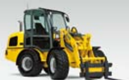
Kolový nakladač WL 57