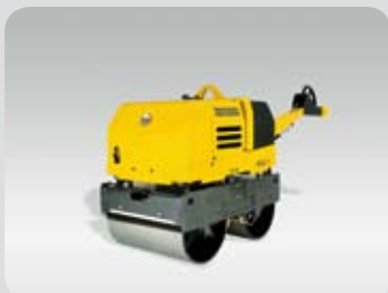
Ručně vedený hladký válec RD 7