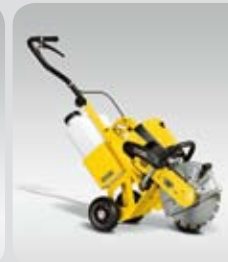
BTS 1035 L3