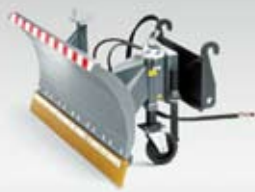
Radlice na sníh

Rozšířili jsme pro Vás nabídku mimo náš základní program pro nejrůznější oblasti použití.