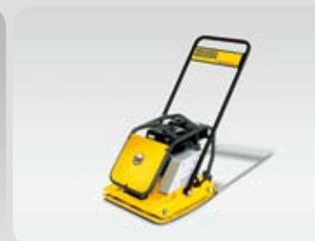
Vibrační deska WP 1550