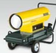
Naftové topidla HD 30