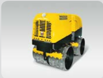
Příkopový hutnicí válec - ježkový RT 82-SC