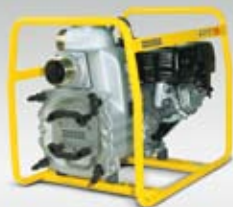
PT 3 A