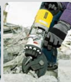
Stříhačky armatur RCP 16