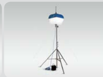
LB 1 – osvětlovací balon