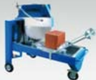
Bloková pila ø 700 mm