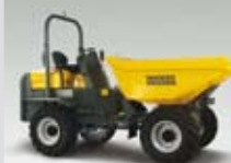
Kolový dampr 6001