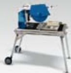
Stolová pila ø 350 mm