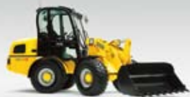
Kolový nakladač WL 48