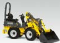
Kolový nakladač WL 18

Kolové nakladače společnosti Wacker Neuson s kloubovým řízením najdou snadno uplatnění v oblasti terénních úprav, stavebnictví, v zahradnictví a krajinářství až po speciální užití. Pronájem kolového nakladače vždy znamená dokonalé zvládnutí nejrůznějších požadavků.