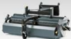
Přídavný zametací stroj