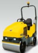
Hladký válec RD 16

Společnost Wacker Neuson je specialista na zhutňování. A s její širokou nabídkou válců zvládnete i nejnáročnější úkoly zcela bez problémů.