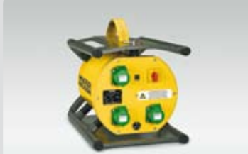
FUE 6 /042 / 200