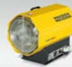
Plynové topidlo HGA 52