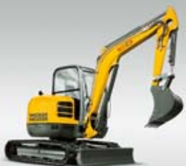
Kompaktní bagr 50Z3