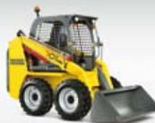
Kompaktní nakladač 701S

Nakladače a dampry nové generace s přesvědčivou výkonnou hydraulikou: mnohostranné a praktické jako švýcarský kapesní nůž. Ideální stroj pro výkonné použití po celý rok.