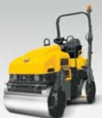
Hladký válec RD 27