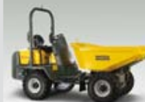
Kolový dampr 3001