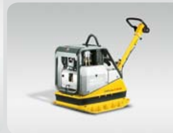
Vibrační deska DPU 6065