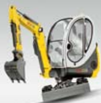
Kompaktní bagr 2003