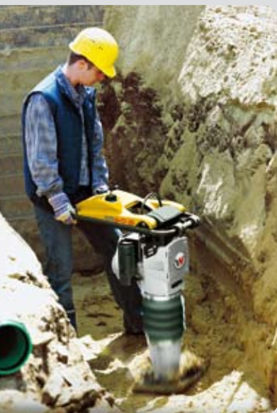
Vibrační pěch BS 60-2

Nabízíme vhodný pěch pro profesionální zhutňování v každé hmotnostní a výkonové kategorii. Vždy originál od vynálezce. Neboť všechny pěchy pocházejí z produkce světové jedničky Wacker Neuson.