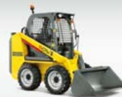
Kompaktní nakladač 501S