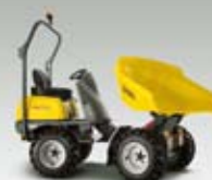
Kolový dampr 1501