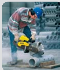
Rozbrušovací pila BTS 1035 L3

Nabízíme širokou nabídku řezaček spár a rozbrušovaček. Všechny řezačky společnosti Wacker Neuson jsou nekompromisní a osvědčené profesionální modely. Najměte si tedy výkonnost v nejlepší formě.