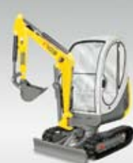
Kompaktní bagr 1703