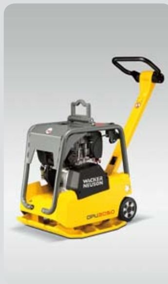
Vibrační deska DPU 3050H

Profesionálové při hutnění půdy a asfaltů spoléhají na Wacker Neuson. Robustní, výkonné a osvědčené modely ve všech hmotnostních třídách pro plné a produktivní osmihodinové nasazení každý den.