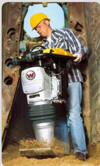
Vibrační pěch BS 70-2i