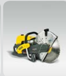
BTS 1140 L3