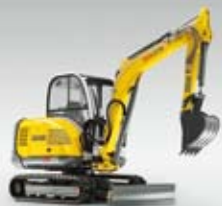
Kompaktní bagr 3503

Kompaktní bagry nabízí sílu a dokonalý pohyb přímo na míru a s vhodným příslušenstvím zvyšuje efektivitu práce. Váš poradce z firmy Wacker Neuson zná všechny možnosti a rád Vám poradí.