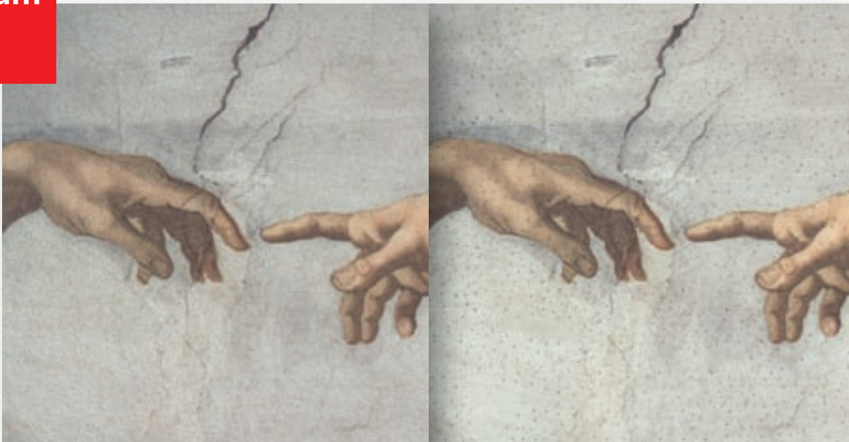
OWAcoustic creaprint Schlicht 9 potisk