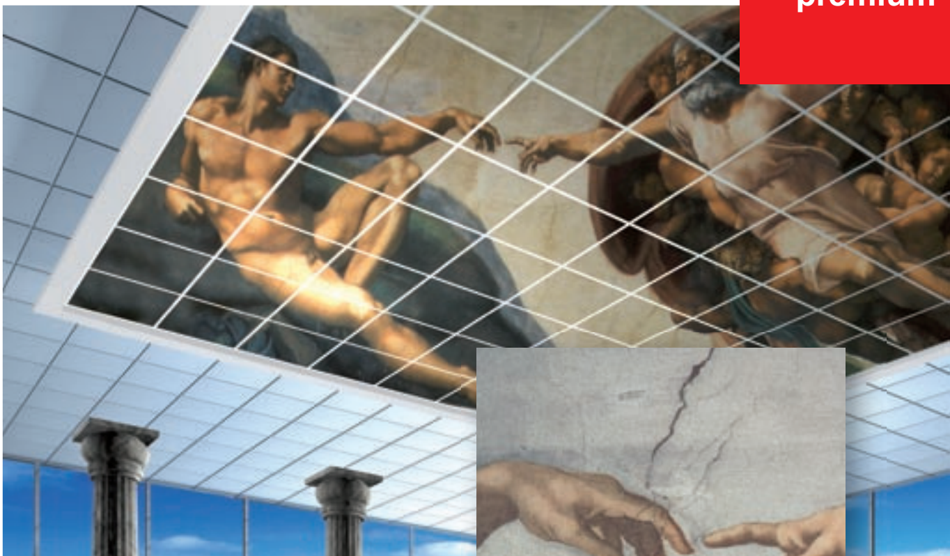
Povrchová úprava creaprint