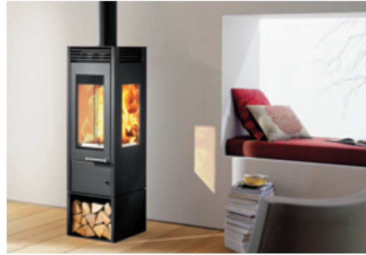
Glass mit Sockel