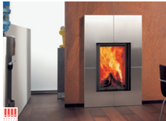
Irony Fireplace 3