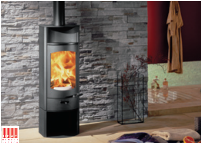
Flok mit Sockel