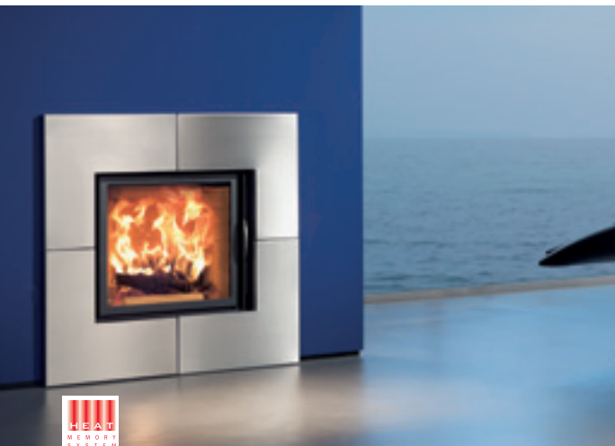
Irony Fireplace 2