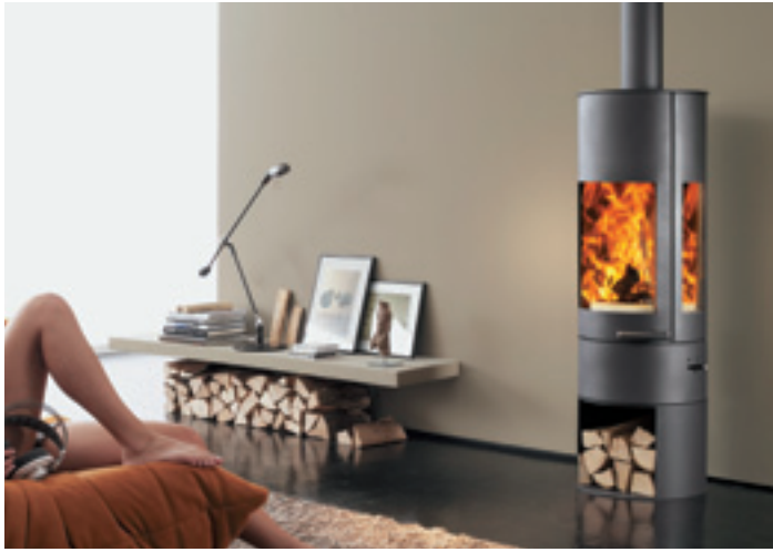
Pi-Ko mit Sockel