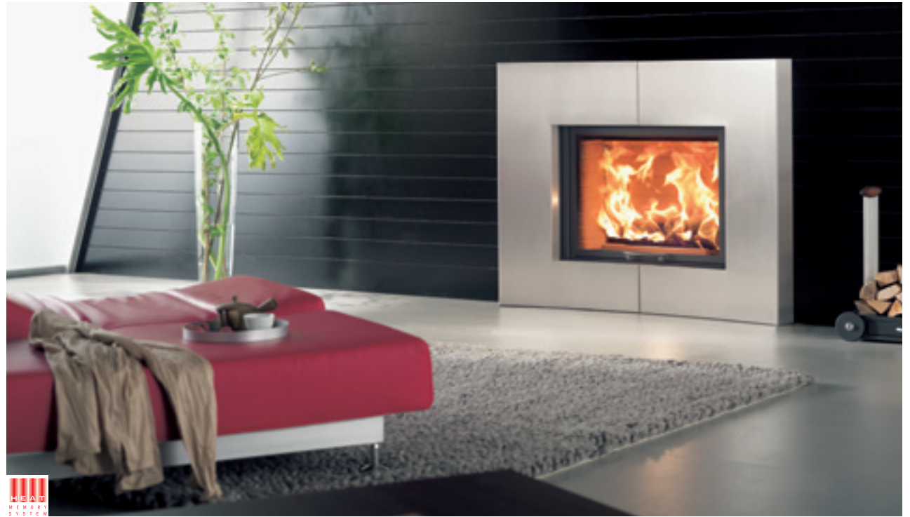
Irony Fireplace 1

Die Irony Fireplaces bieten Ihnen die Wahl Ihrer Wunschfront in Edelstahl, anthrazit oder individuell angefertigt durch Ihren Steinmetz!