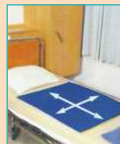
CARECLIDE podložka k přesunu