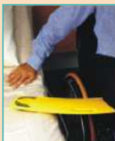
GLIDEBOARD kluzná deska