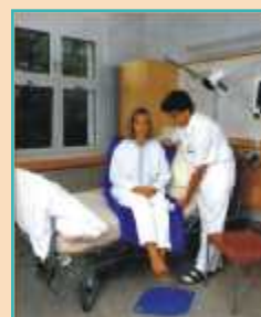
TURNPLATE otočný kotouč