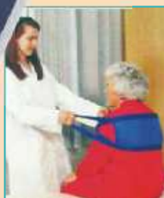
PAT - SLING pro přesun