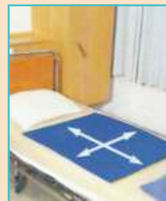
CARECLIDE podložka k přesunu