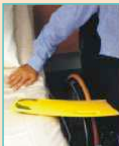
GLIDEBOARD kluzná deska