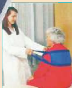
PAT - SLING pro přesun