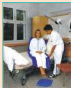
TURNPLATE otočný kotouč