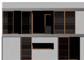
POHLED BOČNÍ (KUCHYNĚ)