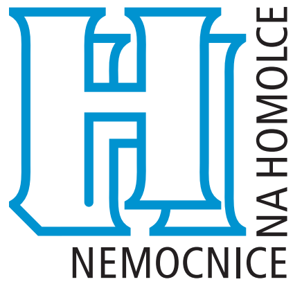
■ logo Nemocnice Na Homolce, 1995 — vítězné logo ze soutěže