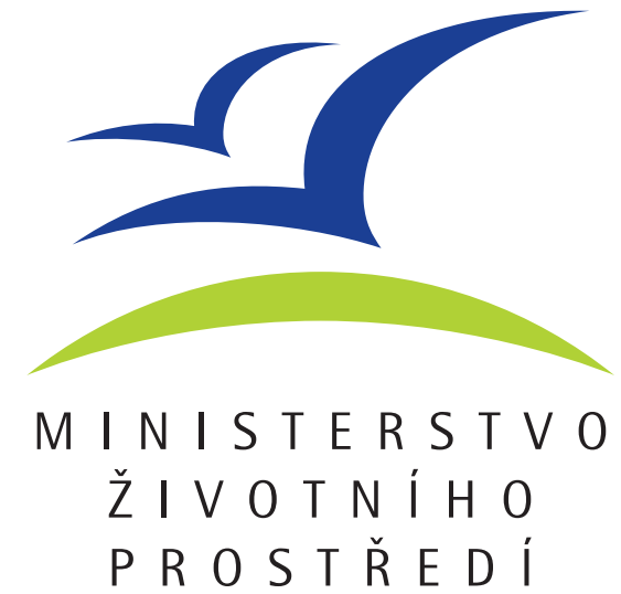
■ logo Ministerstva životního prostředí, 1999 — vítězné logo ze soutěže MŽV