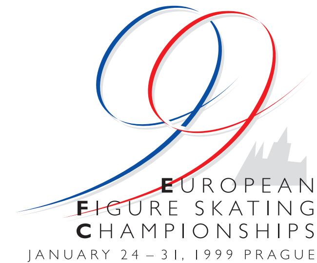
■ logo ME v krasobruslení 99 v Praze, 1998 — vítězné a realizované logo ze soutěže organizačního výboru ME