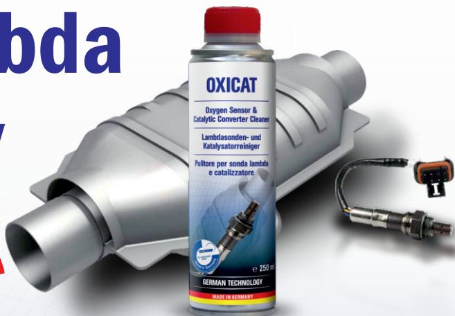
Pohled na mřížku katalyzátoru