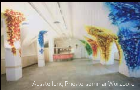
Ausstellung Priesterseminar Würzburg