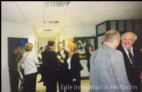
Eitle Innovation in Heilbronn

„Ať v sobě najdeš odvahu vždy hledět vpřed. Ať máš kuráž správným směrem vykročit.“