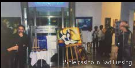
Spielcasino in Bad Füssing